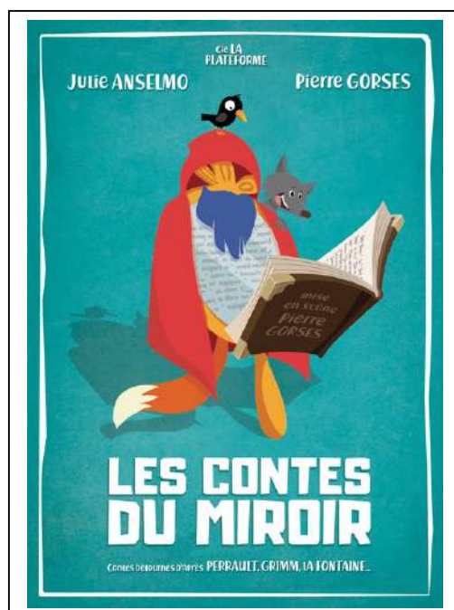
Affiche tout public du spectacle Durée 1h10