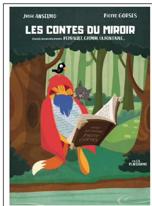
Affiche jeune public du spectacle ( même spectacle moins 10 mn ) durée 1h00

Contact administratif : la30plateforme@orange.fr Contact artistique : 06 08 33 72 15 Site du metteur en scène : www.pierre-gorses.com